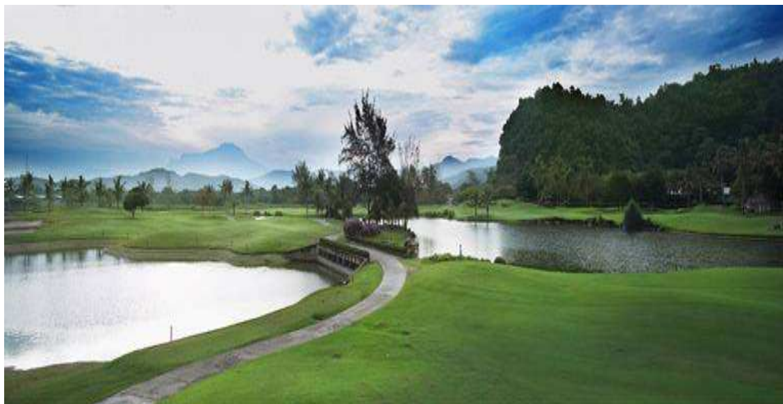
Karambunai Golf Club: Hoteleigener 18 Loch Championship Golfplatz (Par 72).